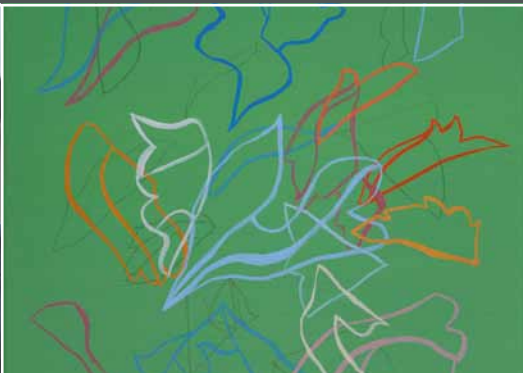
Rainer Nepita, Oberkirch

Linie – Farbe – Form – Fläche – Bildraum. Zeichnen von organischen Formen nach der Natur als erster Schritt um einen Fundus an Formen zu erarbeiten. Daraus werden Bildkonzepte entwickelt, die male- risch ins größere Format umgesetzt werden.